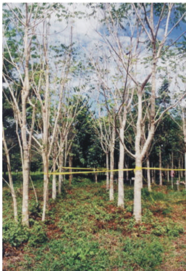
FIG. 2 - Plantas de cedro ( Cedrela odorata ) parcialmente desfolhadas por Pseudobeltrania cedrelae .