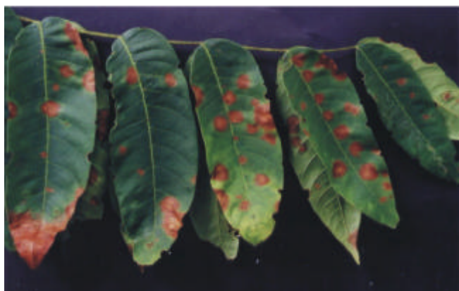
FIG. 1 - Folhas de cedro ( Cedrela odorata ) com manchas causadas por Pseudobeltrania cedrelae .

O teste foi avaliada em folhas novas de mudas de cedro onde foram inoculadas suspensões de 4 \times 10^5 conídios/ml e adicionado 0,05% de Tweem 80. As plantas foram cobertas com sacos de plástico incolor e mantidas em uma câmara de crescimento a 25 °C por 48 h. Posteriormente foram transferidas para casa de vegetação e observadas diariamente durante 30 dias. No oitavo dia após a inoculação, foi observada presença de área clorótica em folhas inoculadas com P.