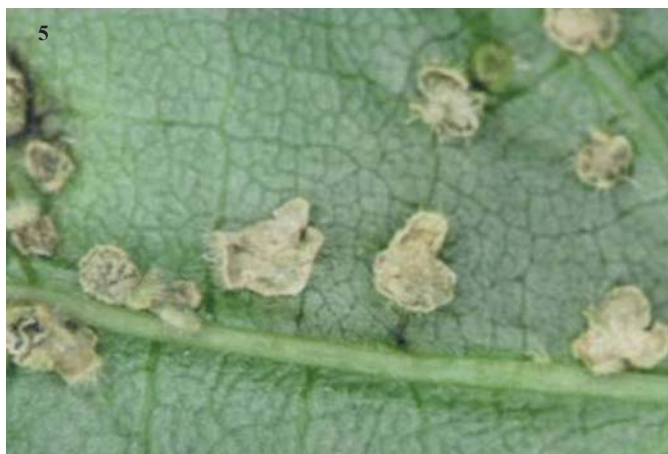
Figura 1. Pústulas de Synchytrium sobre folhas de Abutilon observadas sob estereomicroscópio. 1- Pústulas ou galhas jovens de Synchytrium australe sobre folha de Abutilon sp. 2- Pústulas de Synchytrium australe em vias de maturação. 3- Pústulas ou galhas rompidas, mostrando esporângios amarelos (seta). 4- Detalhe de uma pústula rompida, mostrando esporos de resistência (esporângios ou gametângios) com pigmentação amarela. 5- Galhas totalmente rompidas e livres de esporângios.

especificidade do hospedeiro (gênero ou família) para as espécies parasitas.