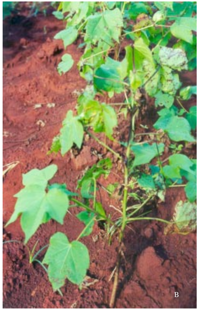
Figura 1. Sintomas de crestamento foliar em algodoeiro causado por Xanthomonas axonopodis pv. malvacearum (A. Inoculação artificial; B. Infecção natural)

contidas em três vasos, cada qual com 3-4 mudas. Folhas totalmente expandidas destas cultivares foram inoculadas, separadamente, por meio de ferimentos por agulhas múltiplas previamente mergulhadas em suspensão bacteriana ( 5 \times 10^8 UFC/mL) ou por pulverização foliar com pressão de 1,0 \text{ kgf/cm}^2 , até o ponto de escorrimento, utilizando uma suspensão de 10^7 UFC/mL, sem entretanto causar anasarca dos tecidos foliares. Plantas controle foram tratadas com água destilada esterilizada. O material inoculado foi mantido em casa-de-vegetação, sob câmara úmida durante 72 h. As linhagens empregadas (IBSBF 1911, 1912, 1913 e 2003) foram capazes de reproduzir tanto os sintomas típicos de mancha angular como os de crestamento foliar, independentemente da resistência genética do hospedeiro.