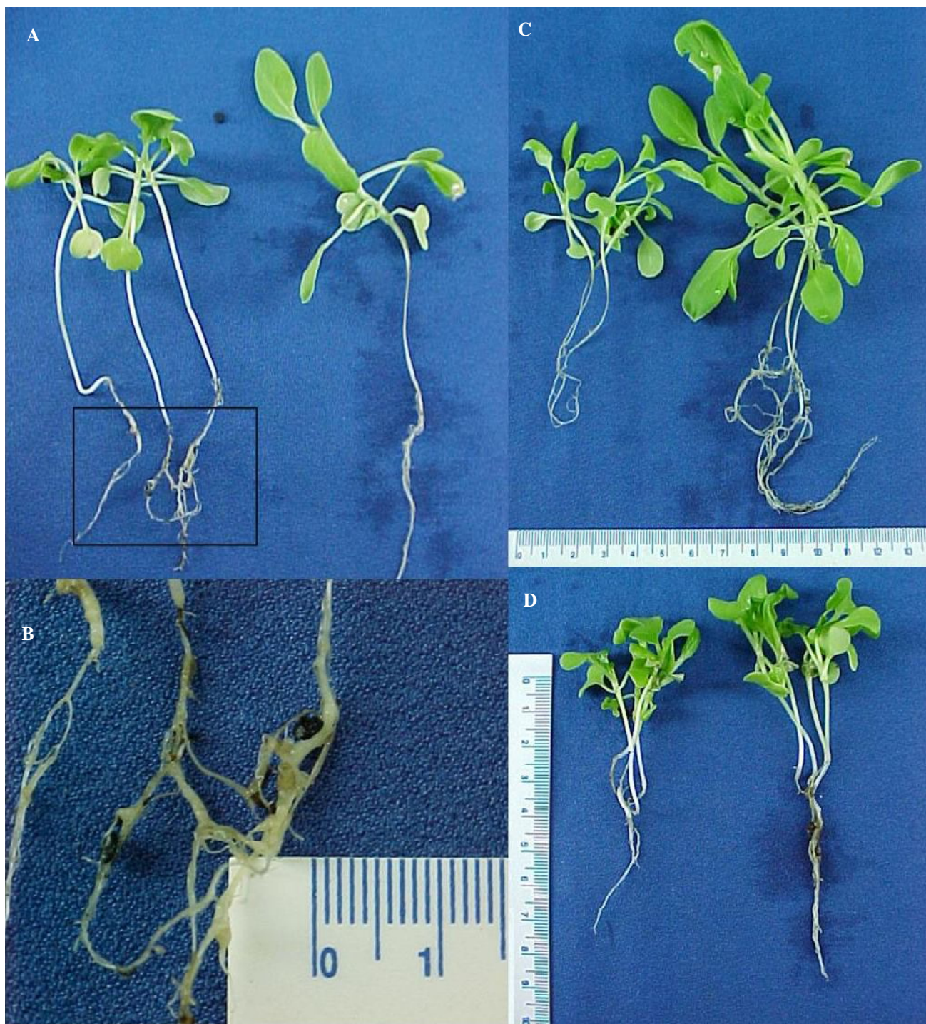
Figura 1. Plantas de Couve chinesas inoculadas e não inoculadas com Plasmodiophora brassicae ; A – Plantas mantidas a 15°C, por 28 dias, presença de galhas nas raízes e redução de raízes na plantas inoculada (esquerda) e raízes saudias na planta não inoculadas (direita); B – Presença de pequenas galhas e intumescimentos radiculares nas plantas inoculadas mantidas a 15°C; C - Plantas mantidas a 20°C, por 28 dias, redução de raízes e de massa na plantas inoculada (esquerda) e planta sadia não inoculada (direita); D - Plantas mantidas a 30°C, por 28 dias, redução de raízes e de massa na plantas inoculada (esquerda) em comparação a planta sadia não inoculada (direita).

temperaturas de infecção, observa-se um comportamento explicado por uma polinomial de segunda ordem, sendo expressa por Y = -0,0048X^2 + 0,2118X - 0,7381 , onde Y corresponde a severidade média da doença, em nota, e X corresponde a temperatura de infecção e desenvolvimento da doença, em °C, sendo que a equação apresentou um coeficiente de determinação, r^2=0,8862 , ou seja, a equação corresponde por 88,62% dos pontos obtidos (Figura 1).