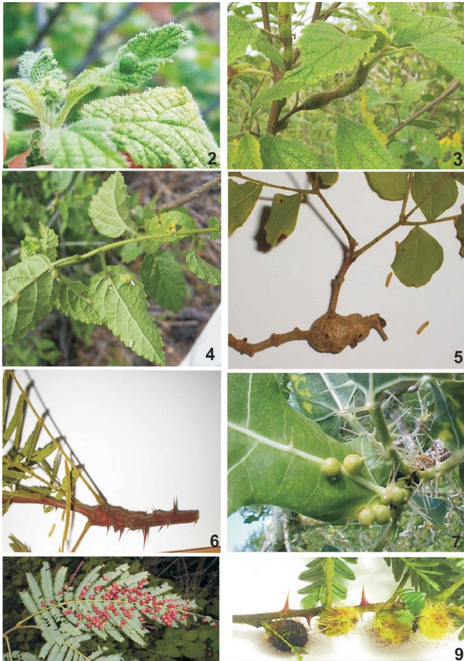
Figuras 2-9 – Galhas encontradas na região de Xingó, Estados de Alagoas, Sergipe e Bahia, Brasil, de agosto de 2005 a abril de 2006. 2. Galha foliar, 3. Galha no ramo e, 4. Galha esférica em Cordia leucocephala ; 5. Galha no ramo em Caesalpinia pyramidalis ; 6. Galha no ramo em Mimosa tenuiflora ; 7. Galha esférica em Cnidoscolus phyllacanthus ; 8. Galha cônica em Anadenanthera colubrina e 9. Galha discoide em Mimosa tenuiflora .

Figures 2-9 – Galls found in the region of Xingó, states of Alagoas, Sergipe and Bahia, Brazil, in August 2005 to April 2006. 2. Leaf galls, 3. Stem gall and 4. Spherical leaf gall on Cordia leucocephala ; 5. Stem gall on Caesalpinia pyramidalis ; 6. Stem gall on Mimosa tenuiflora ; 7. Spherical gall on Cnidoscolus phyllacanthus ; 8. Conical gall on Anadenanthera colubrina ; 9. Discoid gall on Mimosa tenuiflora .