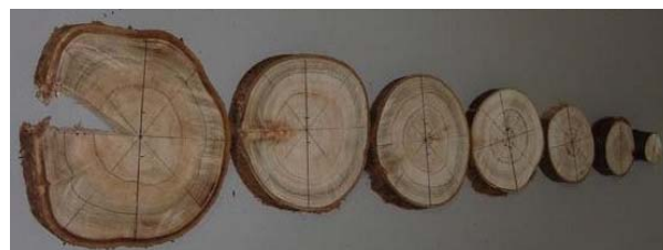
Figura 1 – Demarcação dos anéis de crescimento anuais nas seções transversais em diferentes posições longitudinais do lenho das árvores de eucalipto aos 48 meses.

O resultado da mensuração da circunferência do tronco sem casca de oito árvores de eucalipto/tratamento, a cada 1 m no sentido longitudinal do tronco (diâmetro mínimo de 2 cm), realizada anualmente (1°,