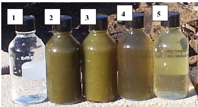
FIGURA 2. Aparência das amostras dos efluentes coletadas nas unidades da ETE-piloto:

Na Figura 2, apresentam-se as amostras dos efluentes coletados na saída das diversas unidades da Estação de Tratamento de Efluente (ETE). Nesta Figura, podem-se observar as características visuais destas amostras.