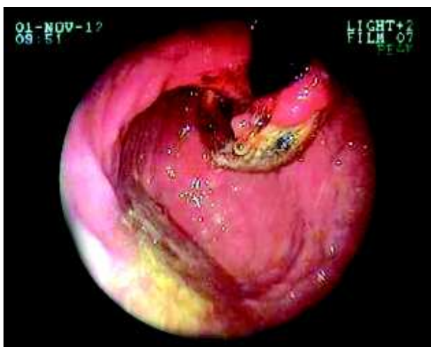
Figura 2 - Extrusão da banda gástrica ajustável: retroversão; identificação da BGAVL no fundo gástrico (fotovideoscopia)

Paciente feminina, 34 anos, no vigésimo quarto mês de pós-operatório de BGAVL realizada em outro estado (SP), procurou o Serviço de