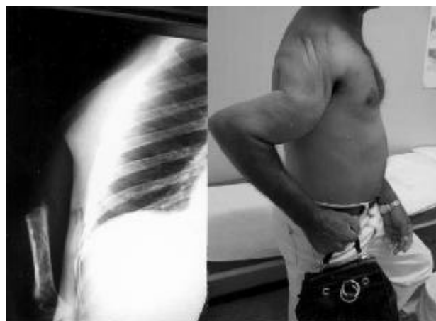
Figura 2 - Raio X do paciente no pós-operatório sem a articulação escápulo-umeral e o mesmo após 6 meses com função do membro preservada.