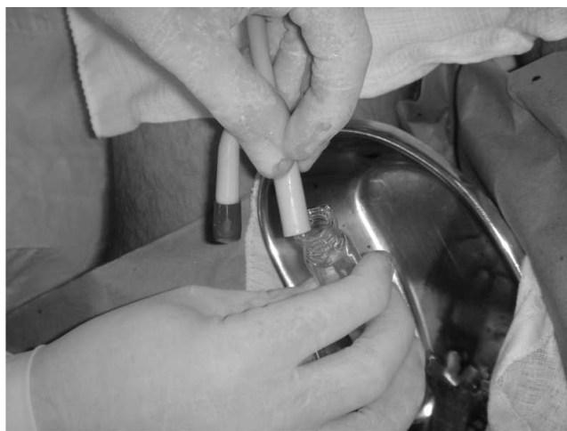
Figura 1 – Coleta da Amostra 1 no Centro Cirúrgico.

A sedimentoscopia foi realizada em câmara de Newbawer, após a centrifugação de 10mL de urina de cada amostra a 3.000 r.p.m..