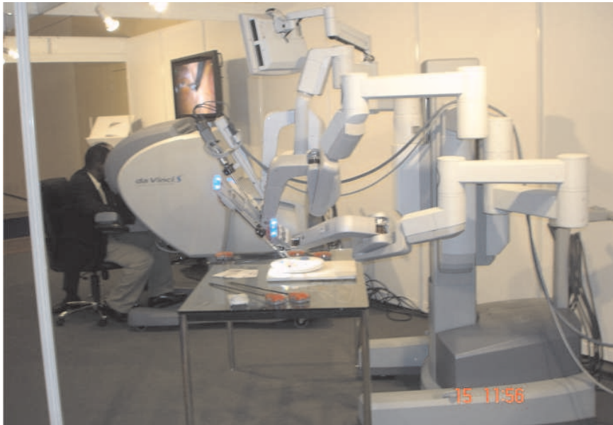
Figura 3 – Set de treinamento do sistema robótico da Vinci®.

Em 2001, o Zeus® foi utilizado em uma cirurgia transatlântica entre Nova York e Estrasburgo (França), por Marescoux e Gagner 16,17 com delay de 155 mseg. É importante ressaltar que atrasos maiores que 200 mseg inviabilizam as operações feitas com grandes distâncias, pois o tecido pode se mover antes da percepção de movimento do cirurgião, podendo causar lesões inadvertidas).