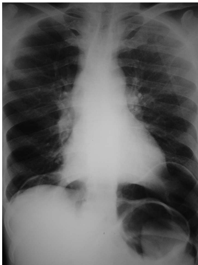
Figura 1 – Radiografia de tórax, ortostática, demonstrando presença de ar infradiafragmático (pneumoperitônio bilateral).

O paciente evoluiu com melhora da dor abdominal e sem complicações pós-operatórias. O período de internação se prolongou por cinco dias para que se pudesse realizar melhor investigação com relação à possível etiologia do pneumoperitônio, através de exames complementares de imagem e endoscópicos. O paciente foi