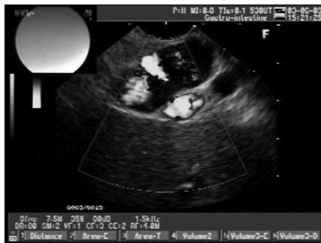
Figura 4 – Ecoendoscopia nas varizes gastroesofágicas com estudo Doppler.

A ultrassonografia endoscópica é o método de imagem com maior acurácia no diagnóstico da camada da parede gástrica comprometida por lesões ou massas, além de estudar a ecogenicidade da lesão, o que ajuda no diagnóstico diferencial 3 .