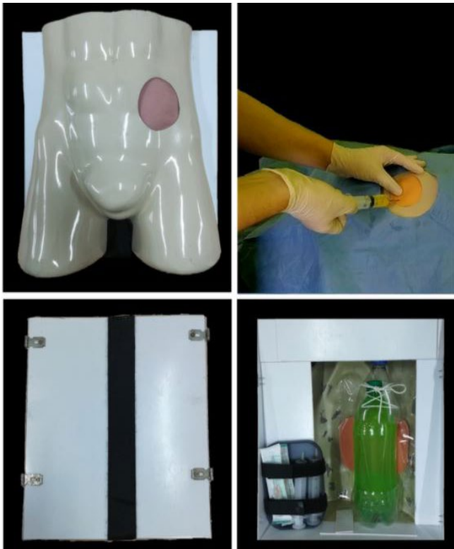
Figura 1. Visão frontal pré-simulação (figura superior esquerda); visão durante aspiração (figura superior direita); visão dorsal externa (figura inferior esquerda), visão dorsal interna (figura inferior direita).

O simulador foi feito a partir dos seguintes materiais: manequim masculino de quadril, garrafas de polietileno tereftalato (PET), folhas de policloreto de vinila (PVC) de 3mm de espessura, silicone de 15x11cm, velcro, seringas e cateter intravenoso 14G (Figura 1). Diferentes materiais foram testados durante a construção do simulador, sendo esses os escolhidos pelas características de baixo custo, fácil disponibilidade e equivalência estética e tátil.