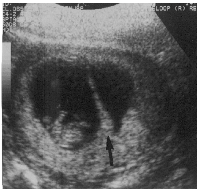
Figura 1 - Determinação da corionicidade em gestação gemelar no primeiro trimestre: massa placentária única e presença do sinal de lambda. Observar a projeção do córion em direção à membrana amniótica (seta), característico da gestação dicoriônica.

Das 169 gestações múltiplas, 93% (n = 157) eram duplas, 6% (n = 10) triplas e 1% (n = 2) quádruplas. Do total de gestações, 87% ocorreram espontaneamente conforme a Tabela 1.