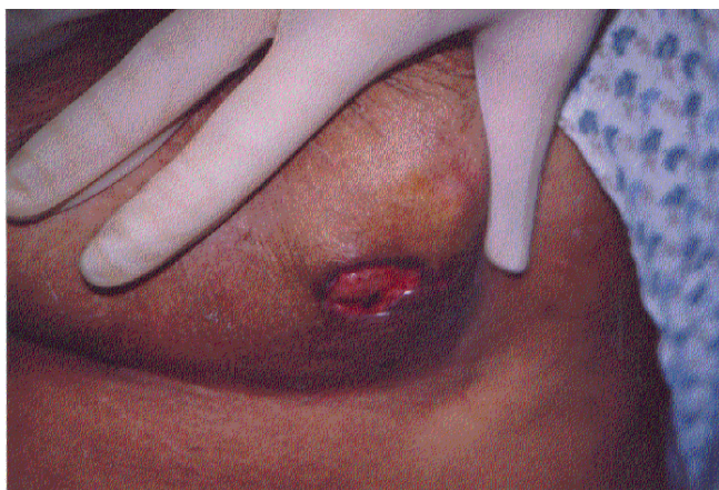
Figura 4 - Lesão mamária ulcerada de fundo limpo.

O exame clínico pulmonar e cardiológico mantinha-se sem alteração. O hemograma demonstrou leucocitose (20.500) com desvio à esquerda, 4% de bastões, 80% de segmentados e 14% de eosinófilos. As provas de coagulação, uréia e creatinina encontravam-se normais, bem como a radiografia de tórax de controle. A pesquisa de BAAR, ELISA para HIV e broncoscopia encontravam-se negativos. Iniciou-se a terapêutica com sulfadiazina-trimetoprim comprimidos (820/180 mg), via oral, de 12/12 horas, mantida por 6 meses e reduzida à metade até completar 12 meses. Em seguida foi instituída terapia de manutenção com sulfadoxina, 500 mg duas vezes por semana, até completar 2 anos de tratamento. A paciente apresentou remissão completa das lesões nos 2 primeiros meses de tratamento.