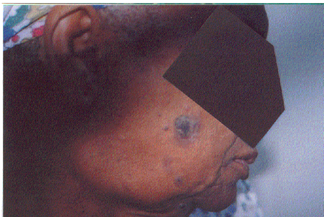
Figura 3 - Lesões granulomatosas da face.