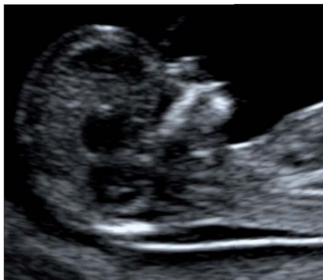
Figura 1 - Imagem adequada para medida da translucência nuchal.

Durante a realização do exame, mais de uma medida deve ser realizada, considerando-se a maior delas para o cálculo do risco. A TN aumenta com o crescimento do comprimento crânio-nádega, tornando-se essencial levar em consideração a idade gestacional ao se definir se a TN está aumentada ou não. O percentil 95 th da TN, quando o comprimento crânio-nádega é 45 e 84 mm, é, respectivamente, 2,1 e 2,7 mm 13 .