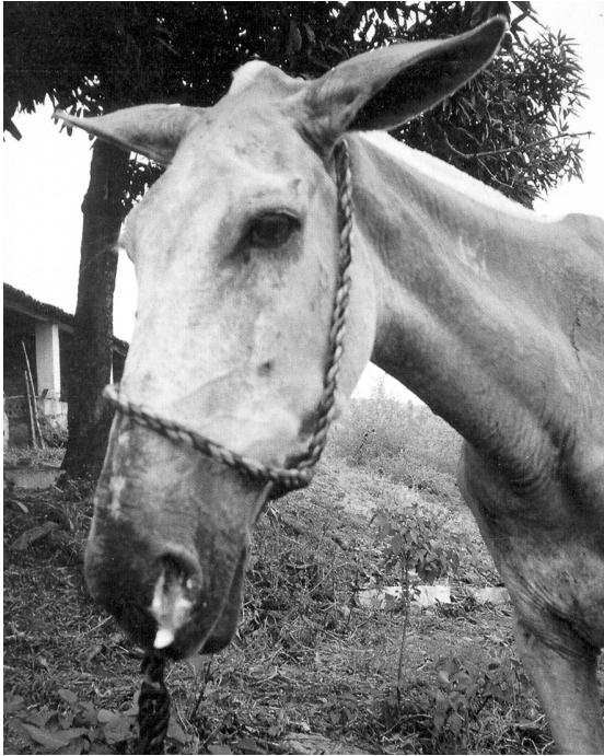
Fig. 1. Mormo em eqüídeo. Descarga nasal muco-purulenta.