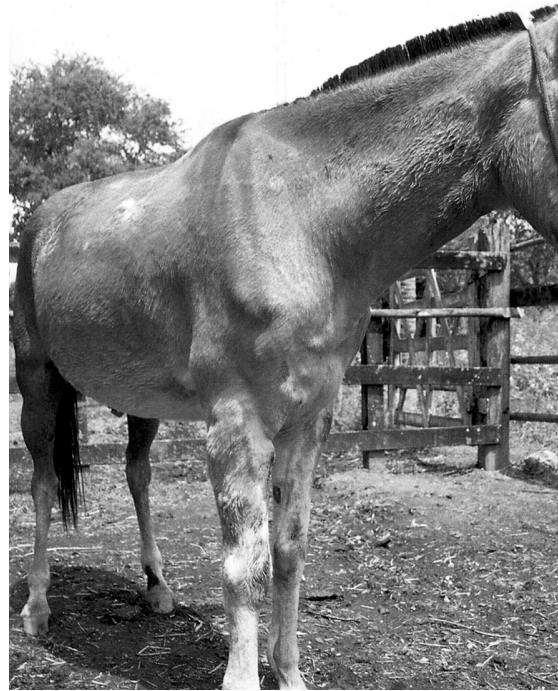
Fig. 2. Granulomas na pele em eqüídeo com mormo.