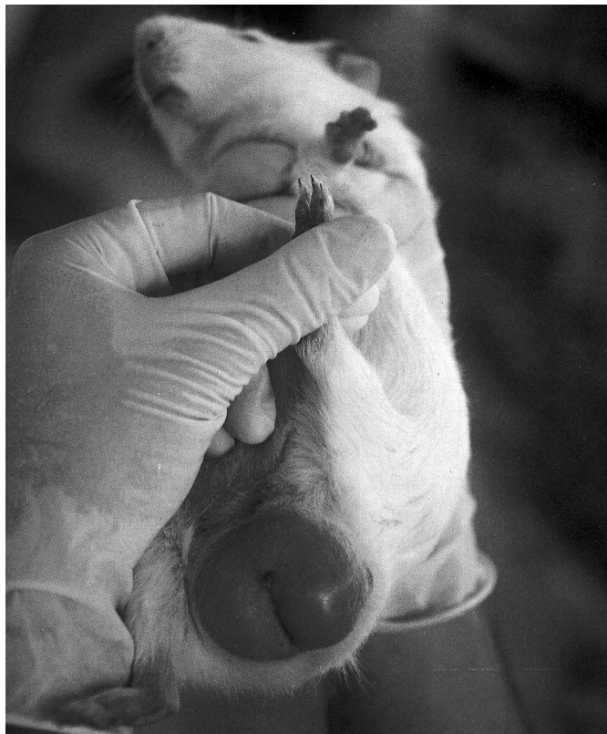
Fig. 4. Prova de Straus positiva. Cobaio apresentando aumento de volume testicular e severa congestão, confirmando o diagnóstico de mormo.