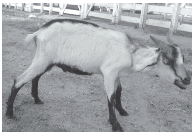
Fig. 2. Marcada dificuldade respiratória e membros abertos de caprino intoxicado experimentalmente por Manihot glaziovii .

o aparecimento dos sinais clínicos ocorreu durante a administração ou até 5 a 10 minutos após o final da mesma. Em todos os animais que apresentaram sinais, a duração dos sinais clínicos até o tratamento foi de 10 minutos a 1 hora (Quadros 6, 7, 8, 9 e 10).