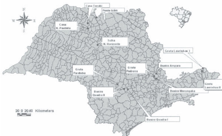
Fig. 1. Localização no Estado de São Paulo dos abrigos diurnos de Desmodus rotundus durante experimento em 1999 e 2000.

Em todas as viagens de visita aos abrigos diurnos de D. rotundus , foram utilizados os materiais comuns às noites de capturas de morcegos como pasta Vampiricida Vallé® (base de Warfarina 2%),