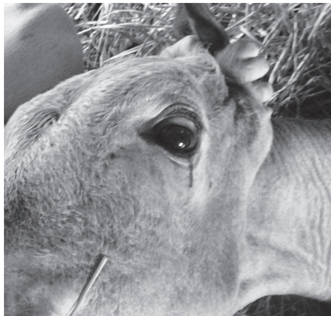
Fig.2. Paralisia do globo ocular quando se rotacionava a cabeça na direção latero-caudal através da verificação da exposição parcial da esclera (Bovino 10).

seguinte foi observada diminuição gradual do tônus muscular, caracterizada pela dificuldade em transpor obstáculos ou no teste de apoio só com os membros torácicos "prova de suspensão dos membros posteriores" ou ainda, durante a contenção dos animais (Fig.1). Neste período era notada progressiva hipotonia nos músculos da cabeça, alguns animais com discreta exposição da ponta da língua entre os lábios e sialorréia. Com o agravamento da hipotonia muscular, os animais se colocavam em decúbito esternal e não conseguiam se levantar, mesmo quando estimulados, mas alguns ainda sustentavam a cabeça e o pescoço. A resposta à avaliação de sensibilidade cutânea