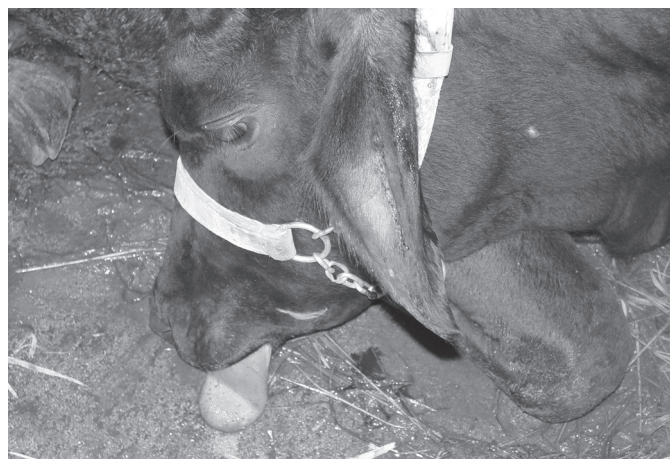
Fig.3. Acentuada diminuição do tônus da língua, o que facilitava sua exteriorização ou dificultava seu recolhimento, além do tempo de sangramento consideravelmente aumentado (Bovino 2).