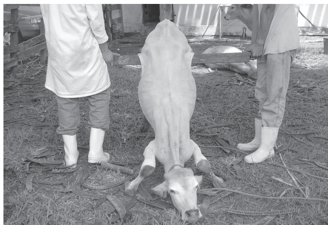
Fig.1. Diminuição do tônus muscular, caracterizado no teste de apoio somente com os membros posteriores na "prova de suspensão dos membros posteriores", no envenenado com a toxina de Crotalus durissus terrificus (Bovino 10).

A primeira alteração observada era o arrastar das pinças seguido pela discreta diminuição da resposta aos estímulos externos, que se evidenciava pela redução do raio de aproximação e a permissão do contato manual. Na fase