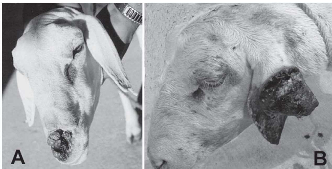
Fig.1. Carcinoma epidermóide. (A) Ovino (Caso 1) com lesão na narina. (B) Ovino (Caso 5) com lesão proliferativa com aspecto granular de superfície ulcerada e necrótica na orelha esquerda.

a Ni = não informado, b SRD = sem raça definida.