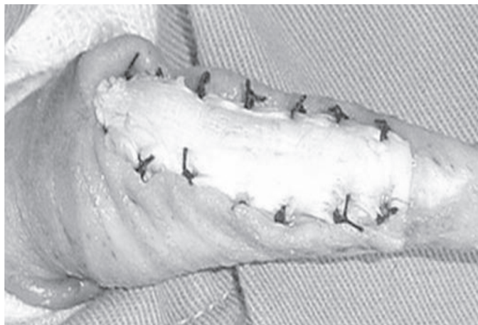
Fig.3. Aspecto da fixação da cartilagem auricular sobre a túnica albugínea peniana com pontos simples separados.

do segmento auricular foi removida sob tração com de pinças hemostáticas. Foi retirado uma tira da cartilagem nas dimensões de aproximadamente 8,0cm de comprimento por 1,0cm de largura e mantida em frasco fechado com solução fisiológica a 0,9% na temperatura ambiente até o momento do implante.