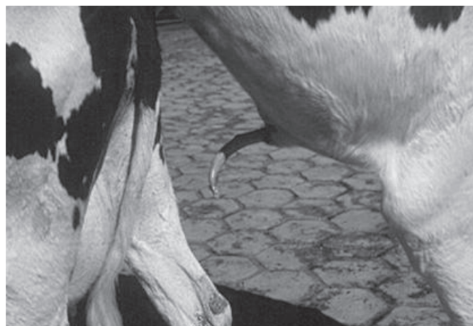
Fig.2. Bovino em monta natural decorrido 60 dias da remoção do ligamento apical do pênis. Observa-se a extremidade livre do pênis desviada ventralmente e para a direita.

Silva 2002), e a pele aproximada com pontos simples separados e fio catagute 00 9 (Fig.1)