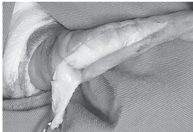
Fig.1. Remoção do ligamento apical na extremidade livre do pênis de bovino sem raça definida.

Foram utilizados 18 novilhos sem raça definida, com idade de 18-24 meses e aparentemente sadios. Os novilhos foram observados em monta natural para assegurar a ausência de alterações no instinto sexual ou anomalias no pênis. Após jejum de alimentos sólidos de 24 horas e hídrico de 12 horas foram sedados com cloridrato de xilazina 7 (0,2mg/kg/peso, IM). Para exposição do pênis foi realizada analgesia epidural caudal com 10,0mL de cloridrato de lidocaína a 2% com adrenalina 8 . Após tricotomia do óstio prepucial e anti-sepsia do pênis e lâmina externa do prepúcio com polivinil-pirrolidona iodo a 10%, foi praticada incisão longitudinal no terço médio da superfície dorsal da extremidade livre do pênis, cerca de 7,0cm de comprimento. Foi removido, em média, 6,0cm do ligamento apical (Eurides &