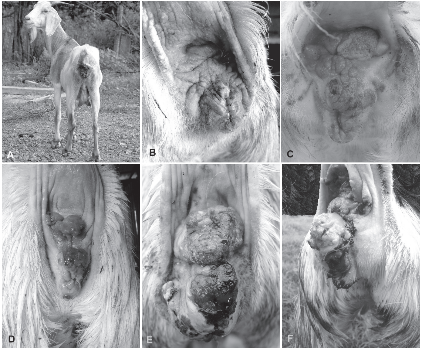
Fig.1. Cabras com carcinoma de células escamosas em vários estágios de evolução, na região perineal despigmentada, Pará, Brasil. (A-C) Propriedade no município de Garrafão do Norte. (D-F) Propriedade no município de Viseu.

dos nódulos mais desenvolvidos observavam-se pequenas placas, nódulos menores ou simplesmente rugosidades. O tamanho e a quantidade de ulcerações eram variados, mas predominavam nas lesões bem desenvolvidas. Na maioria dos casos havia exsudato seroso na superfície da lesão que atraía moscas, porém, em alguns animais, o exsudato era purulento.