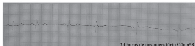
Fig.3. Registros eletrocardiográficos em derivação DII (Cão 8). Diminuição da amplitude de complexos QRS no momento de 24 horas de pós-operatório; v: 50mm/s.