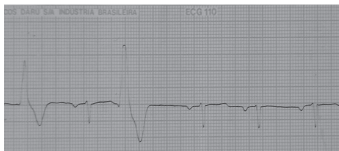
Fig.1. Registro eletrocardiográfico em derivação aVR (Cão 7). Presença de complexos ventriculares prematuros no momento de 12 horas de pós-operatório; v: 50mm/s.

Noventa por cento dos cães mostraram diminuição da amplitude do complexo QRS, nas primeiras 24 horas de