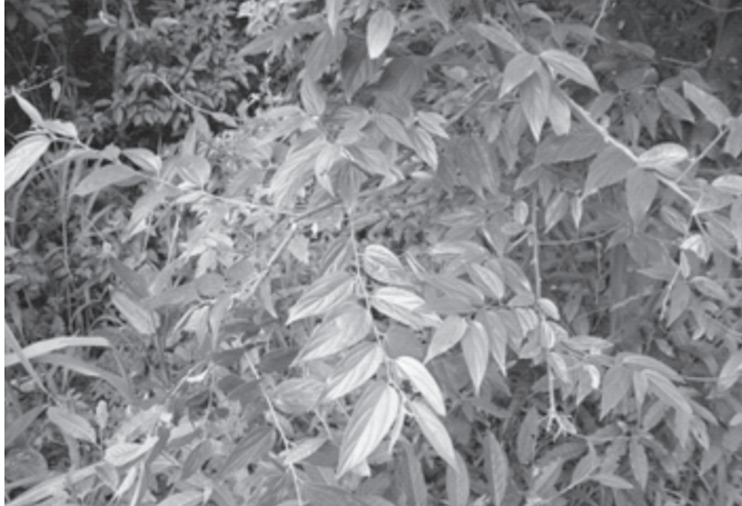
Fig.1. Trema micrantha L. em Santa Catarina.

Trema micrantha L. (Fig.1), da família Ulmaceae, é encontrada em todo Brasil e conhecida vulgarmente por grandíuva, pau-pólvora ou periquiteiro (Lorenzi 1992). Intoxicação espontânea por folhas desta árvore foi descrita em caprinos no Rio Grande do Sul (Traverso et al. 2003, 2005) e intoxicação experimental foi descrita em coelhos (Traverso & Driemeier 2000), cabras (Traverso et al. 2002) e bovinos (Traverso et al. 2004). O presente estudo tem como objetivo relatar o primeiro surto de intoxicação natural por T. micrantha ocorrida no estado de Santa Catarina.