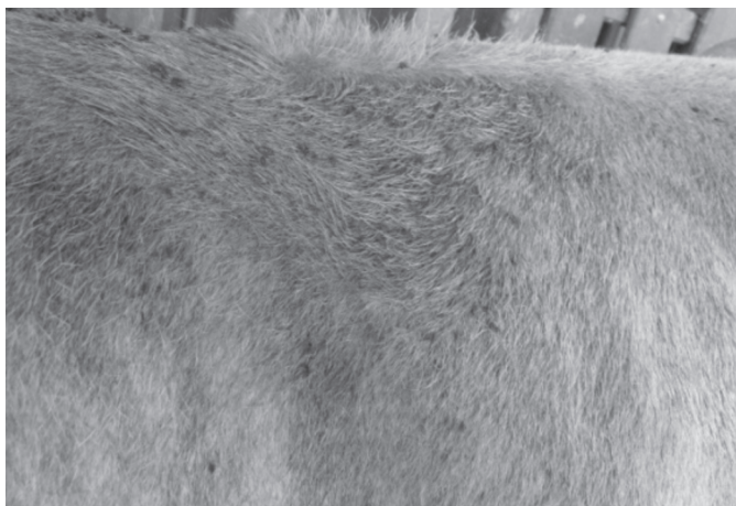
Fig.1. Bovino mestiço, fêmea com mudança na direção dos pelos na região do dorso causada pela lambedura.

As feridas foram observadas em 13 bovinos, sendo 12 fêmeas e um macho, das raças nelore, guzerá e holandesa, também em mestiços das raças holandesa e simental. À inspeção dos animais foi verificado que a maioria apresentava escore corporal ruim. Dos 13 bovinos, 12 apresentavam uma única ferida e somente um animal apresentava três feridas. Essas feridas ocorriam somente em regiões do corpo onde os animais tinham acesso com a própria língua, como costado, membros, abdômen e dorso. Inicialmente observou-se mudança na direção dos pelos (Fig.1) e aglutinação dos mesmos pela saliva. Com a continuação das lambeduras havia perda dos pelos, em seguida o aparecimento de pequenas lesões nas camadas superficiais da pele (Fig.2). Após o surgimento destas lesões iniciais havia uma maior atração de insetos para essa lesão o que estimulava ainda mais o animal a lamber-se,