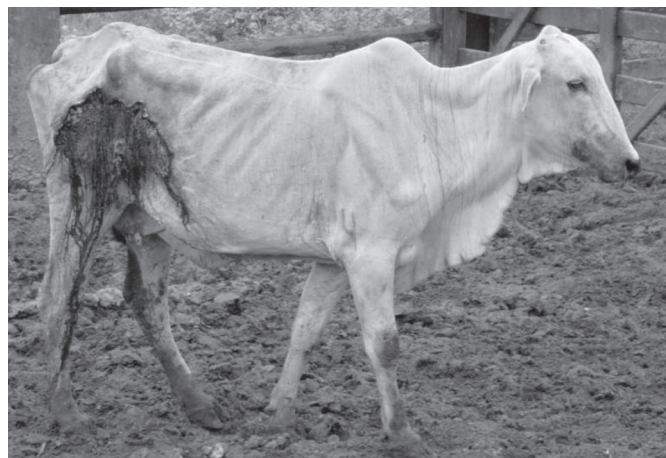
Fig.4. Bovino nelore, fêmea com extensa ferida de bordo irregular, de coloração avermelhada com exudação serossanguinolenta. Observa-se que a região ao redor boca está impregnada por secreção oriunda da ferida.

causando lesões mais profundas e extensas (aprox. 20cm de diâmetro) na pele (Fig.3), o que provocava exsudação serossanguinolenta (Fig.4). Foi verificada também secreção sanguinolenta ao redor da boca dos animais acometidos (Fig.4). Nos dois animais que foram impossibilitados de ter o acesso a ferida, as mesmas diminuíram consideravelmente de tamanho. Em dois animais que apresentavam feridas em fase de cicatrização, os bordos ficaram esbranquiçados.