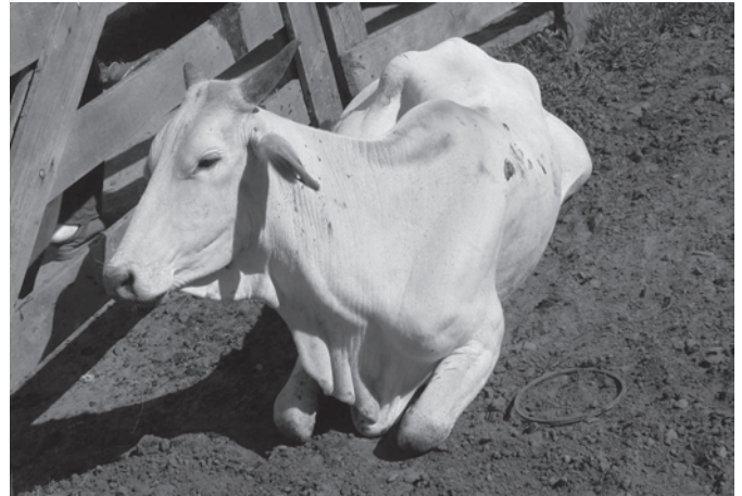
Fig.4. Bovino em decúbito external com a veia jugular ingurgitada, intoxicado pela ingestão de Amorimia exotropica no Estado do Rio Grande do Sul.

Na Propriedade C, localizada em Dois Irmãos/RS, havia um rebanho de 20 bovinos em um piquete de campo nativo com área de 1,5 hectares e pouca disponibilidade de pasto. Em junho de 2006, os bovinos ganharam acesso a um piquete novo, no qual havia uma capoeira, onde se observaram exemplares de A. exotropica com sinais de terem sido consumidos. Um mês após a entrada dos animais nesse novo piquete, dois "bois de canga" adultos morreram de forma súbita durante o trabalho. Trinta dias após, outro bovino (fêmea mestiça, sete anos, bovino 4)