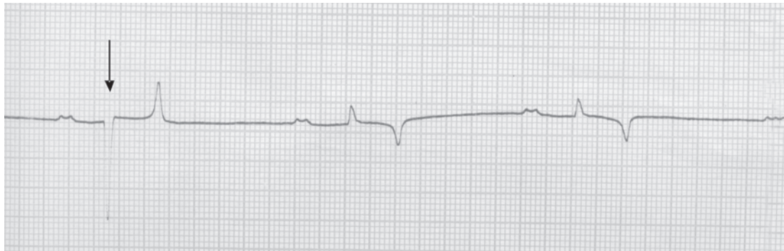
Fig.4. Eletrocardiograma de equino macho da raça Hanoverano com 10 anos, com contração ventricular prematura na derivação bipolar II. Note-se a presença de complexo QRS de conformação bizarra (seta). Velocidade: 25mm/s. Sensibilidade: 1cm = 1mV.