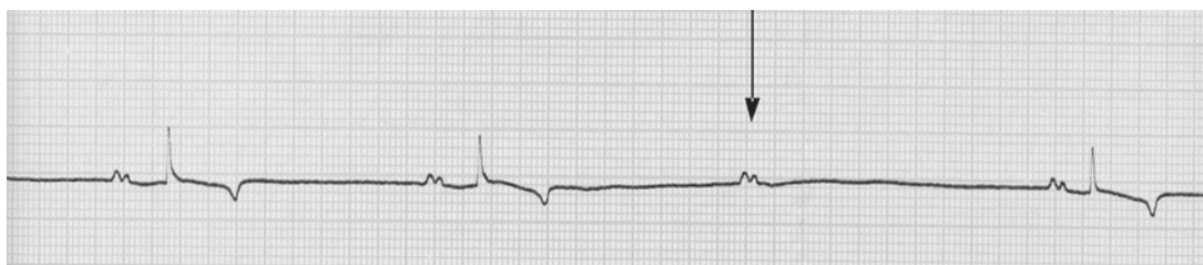
Fig.2. Eletrocardiograma de equino fêmea da raça Brasileiro de Hipismo com 9 anos, com bloqueio atrioventricular de 2º grau na derivação unipolar aumentada aVL. Note-se a presença de uma onda P desacompanhada de complexo QRS. Velocidade: 25mm/s. Sensibilidade: 1cm = 1mV.