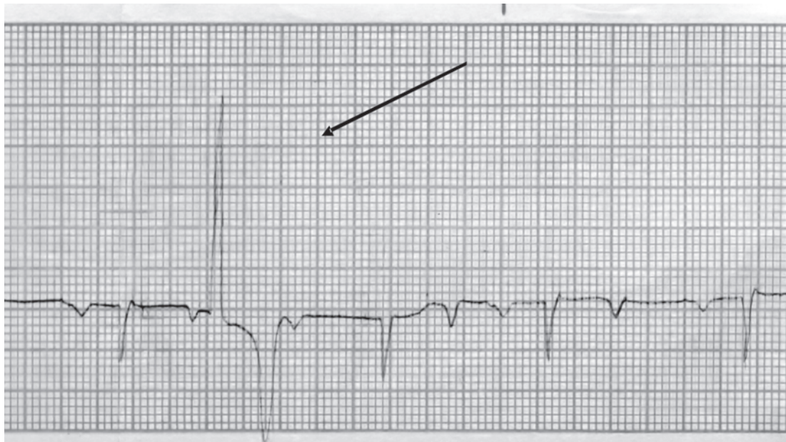
Fig.5. Eletrocardiograma de equino fêmea da raça Zangerchaid com 8 anos, com contração ventricular prematura na derivação unipolar aumentada aVF. Note-se a presença de complexo QRS precoce, largo, de conformação bizarra (seta). Velocidade: 25mm/s. Sensibilidade: 1cm = 1mV.

miocárdica, mesmo sem sinais clínicos de doenças cardiovasculares (Mitten 1996) e segundo Ryan et al. (2005), as contrações ventriculares e supraventriculares prematuras podem ser induzidas pelo exercício, em animais saudáveis. No presente trabalho, os equinos que apresenta-