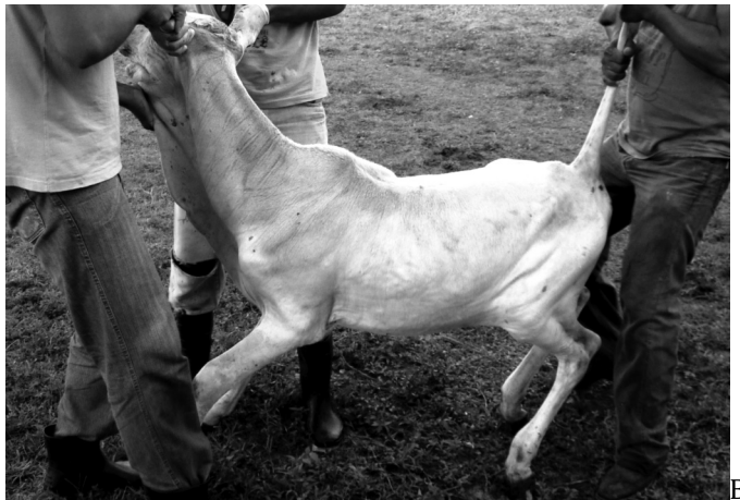
Fig.1. (A) Bubalino 121 e (B) Bovino 1 inoculados com a peçonha de Crotalus durissus terrificus , com incapacidade de se manterem em estação (paralisia flácida).