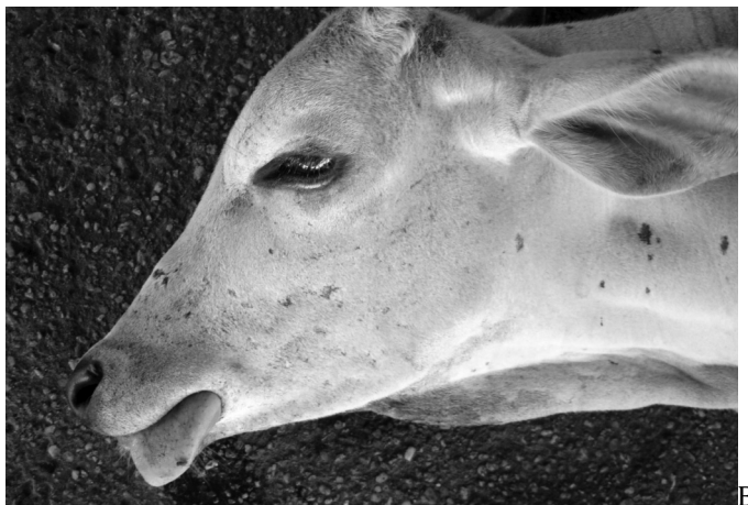
Fig.3. (A) Bubalino 121 e (B) Bovino 2 com diminuição do tônus da língua.