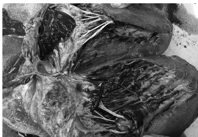
Fig.5. Áreas multifocais de hemorragia no endocárdio ventricular, na intoxicação por Pterodon emarginatus (Bovino 2).

mas após dez dias do início dos sinais clínicos, ainda haviam nove animais doentes muito debilitados.