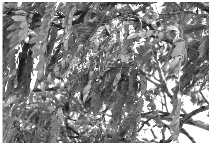
Fig.2. Detalhe das folhas e dos frutos maduros de Pterodon emarginatus . Indiara/GO.