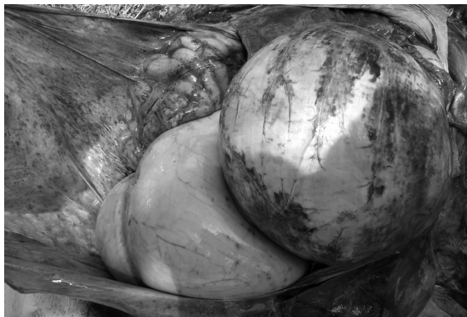
Fig. 6. Hemorragias irregulares no omento, mesentério e serosa do rúmen, na intoxicação de bovino por Pterodon emarginatus (Bovino1).