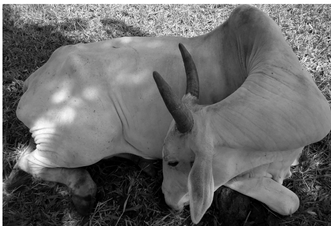
Fig.3. Bovino em decúbito esternal, extremamente prostrado e com a cabeça voltada para o flanco direito, na intoxicação por Pterodon emarginatus .

Macroscopicamente, foram observados, à necropsia, fígado aumentado de volume e com numerosas áreas irregulares, esbranquiçadas ou amareladas, friáveis, multifocais a coalescentes (Fig.4). A lobulação hepática era bastante evidente, principalmente após a fixação com formol (Fig.4). A vesícula biliar estava muito distendida e com parede edemaciada. Petéquias e equimoses foram visualizadas em grande quantidade no pericárdio e endocárdio (Fig.5), pleura parietal, mesentério, omento, serosa do rúmen (Fig.6), baço, pulmão, subcutâneo e musculatura intercostal e torácica lateral. Foi observada grande quantidade de folhas e poucos frutos de P. emarginatus no conteúdo do rúmen. O conteúdo fecal do reto estava extremamente seco, endurecido e sanguinolento.