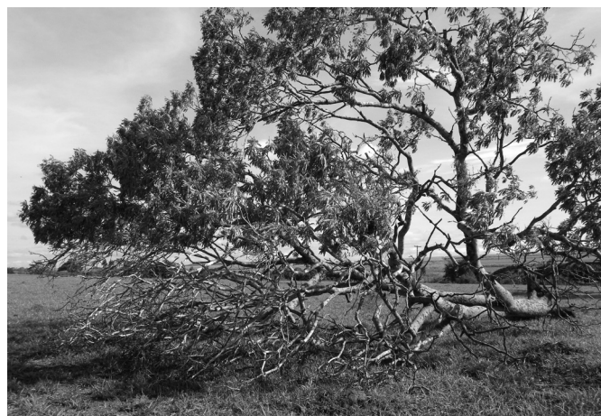
Fig.1. Pterodon emarginatus caída ao solo após tempestade. Nota-se que as folhas da árvore que ficaram ao alcance dos bovinos foram todas consumidas. Indiara/GO.

Três dias após a queda da árvore, todos os bovinos do lote manifestaram sinais de intoxicação e sete morreram (cinco vacas e dois rufiões) (morbidade 100%, mortalidade e letalidade 8,33%). Os sinais clínicos incluíam eriçamento dos pelos, retração do flanco, apatia profunda, prostração, tremores musculares, ressecamento do focinho, tenesmo, incoordenação, relutância em movimentar-se e decúbito esternal prolongado. Alguns bovinos apresentaram urina alaranjada com odor muito forte e outros permaneciam em decúbito lateral com a cabeça voltada para o flanco (Fig.3). Muitos animais pararam de ruminar, com ausência de movimentos ruminais completos em um período de cinco minutos. O curso clínico foi de 36-72 h. As atividades séricas de AST, ALT e GGT e os teores de bilirrubina total, direta e indireta estavam acentuadamente elevados nos bovinos avaliados do lote (Quadro 1).