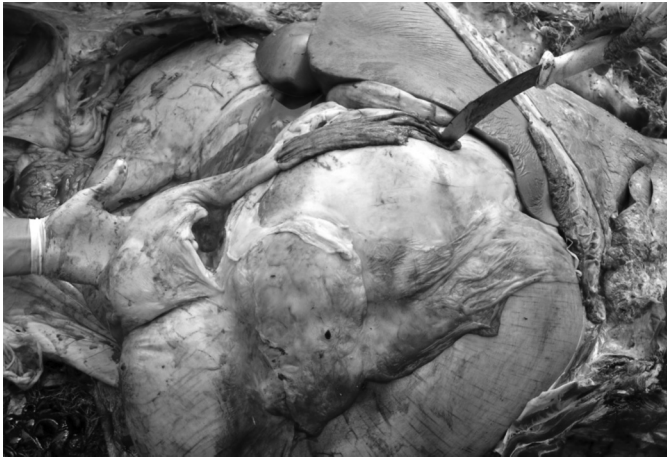
Fig. 2. Surto de compactação de abomaso em bovinos leiteiros associado ao consumo de silagem de girassol. Distensão acentuada de abomaso e omaso, e fígado amarelado (Bovino 2).