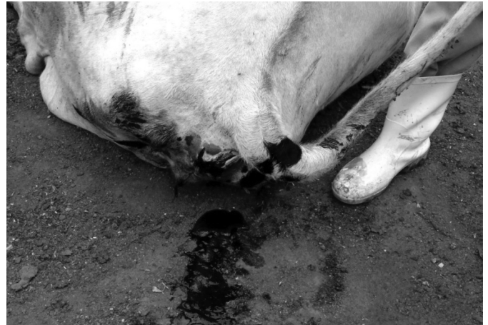
Fig.1. Surto de compactação de abomaso em bovinos leiteiros associado ao consumo de silagem de girassol. Fezes pastosas e escuras, com aspecto de piche (Bovino 3).

A compactação de abomaso ocorreu numa propriedade rural destinada à produção de leite no município de Nepomuceno, Minas Gerais, Brasil. O rebanho era composto principalmente por bovinos da raça Holandesa e um lote do rebanho era formado originalmente por 21 vacas de três a cinco anos de idade, não lactantes (vacas secas), em terço final de gestação e com data do parto próxima. Em outubro de 2005 todos os animais do referido lote apresentaram quadro clínico, de intensidade variada, caracterizado por apatia, mucosas pálidas, desidratação acentuada, abdômen distendido, fezes ressecadas e escassas que, em alguns bovinos, tornaram-se pastosas e escurecidas, lembrando piche (Fig.1). Num dos animais houve antecipação do parto em três dias, com parição de um natimorto. Cada vaca recebia aproximadamente 25 kg/dia de silagem de girassol (planta inteira), sem outros componentes na dieta. O cultivar de girassol utilizado foi o IAC Uruguai, de ciclo tardio e indicado para produção de óleo. A colheita foi realizada 147 dias após o plantio, realizado no final de março de 2005. Na colheita as plantas apresentavam folhas totalmente secas; capítulos e caules acastanhados e secos e 100% dos grãos estavam