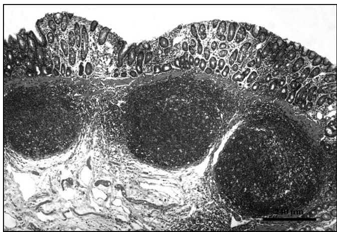
Fig.3. Corte histológico de biópsia de mucosa retal de ovino, folículos linfoides com centro germinativo bem delimitado. HE, obj.10x.

desparafinados e tratados em solução 10% de peróxido de hidrogênio (Merck, Darmstadt, Germany) em metanol por 20 minutos, lavados em água destilada e tratados com ácido fórmico (Merck, Darmstadt, Germany) por cinco minutos. Posteriormente, realizou-se: a lavagem com água destilada e TBS (Tris base, Tris-HCl, NaCl; DAKO®, Carpinteria, USA), por dois minutos; lavagem rápida com 0,1% de Tween (Sigma Chemical Co., Saint Louis, USA) diluído em TBS, por um minuto; lavagem em água destilada, por um minuto; recuperação antigênica e eliminação de PrP C com proteinase K (DAKO Cytomation, Carpinteria, USA), por um minuto e lavagem em água destilada gelada. Para a diminuição das ligações inespecíficas, utilizou-se leite desnatado (Molico®, Nestlé, Brasil) na diluição de 5%, por 20 minutos, e lavados em TBS, por dois minutos.