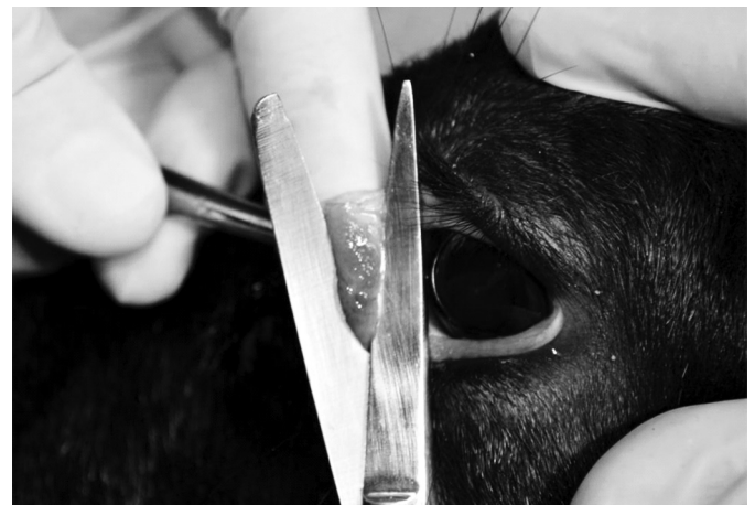
Fig.1. Técnica para coleta de biópsia de terceira pálpebra em ovino para imuno-histoquímica de scrapie. Exposição da terceira pálpebra com auxílio da fixação por pinça para retirada do tecido com tesoura.

As amostras de terceira pálpebra e de mucosa retal foram fixadas em formol tamponado 10% neutro durante 24 horas e processadas pelas técnicas de rotina histológica e subsequente coloração em hematoxilina-eosina (HE) (Fig.3). A detecção do príon pela técnica de IHQ ocorreu pelo método estreptavidina-biotina ligada à peroxidase. Inicialmente os cortes histológicos foram