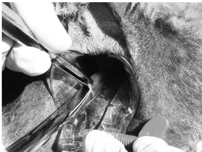
Fig.2. Técnica para coleta de biópsia de mucosa retal em ovino para imuno-histoquímica de scrapie. Exposição da mucosa retal com auxílio de espéculo, após anestesia local, pinçamento e corte com tesoura.