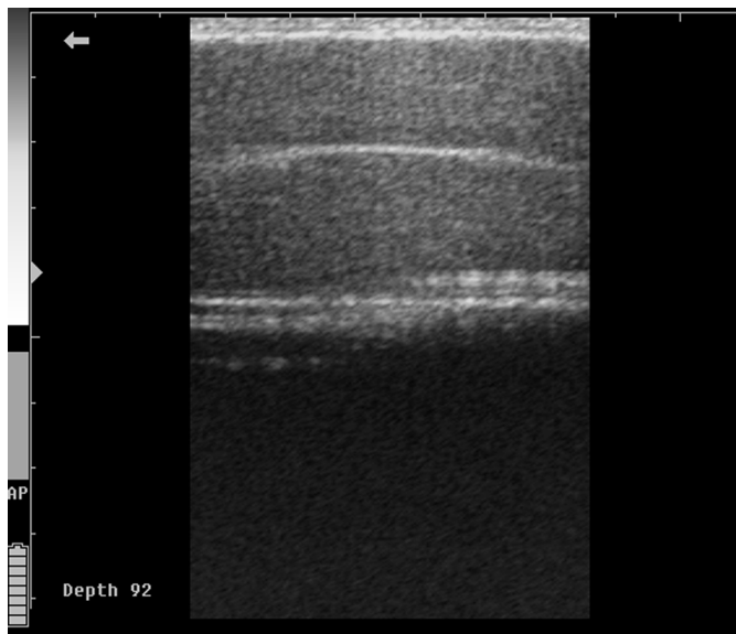
Fig.1. Imagem ultrassonográfica em plano sagital do parênquima testicular (PT) e mediastino testicular (MT). São Luís/MA, 2013.

Quando comparada a ecogenicidade do parênquima testicular pelo histograma escala-cinza em relação às faixas etárias, observou-se variação de 69,91 a 113,42 pixels,