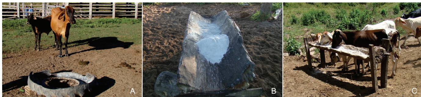
Fig.2. Cochos sem cobertura utilizados para a suplementação mineral de rebanhos bovinos da bacia leiteira do município de Rondon do Pará. (A) Cocho produzido de pneu de trator da Propriedade I, Abel Figueiredo, PA. (B) Cocho de madeira da Propriedade XI, Rondon do Pará, PA. (C) Cocho de madeira da Propriedade XII, Rondon do Pará, PA.

* Calcularam-se estas quantidades a partir das informações obtidas nos rótulos das embalagens das misturas minerais ofertadas aos animais.