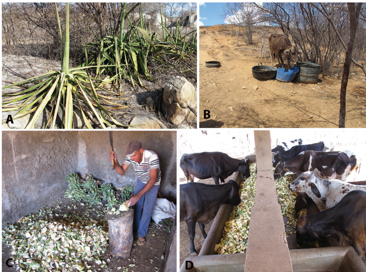
Fig.1. (A) Agave sisalana com folhas amareladas e secas, Matureia/PB, registro em 12 nov. 2012. (B) Ausência de forragem no piquete onde os bovinos, que tiveram compactação ruminal, eram criados. (C) Caules de Agave sisalana sendo picados a facão para fornecimento para o gado. (D) Rebanho bovino comendo A. sisalana .

Objetivou-se com esse trabalho descrever os aspectos epidemiológicos e as alterações clínico-patológicas de um surto de alterações digestórias em bovinos alimentados com A. sisalana , no município de Matureia, estado da Paraíba.