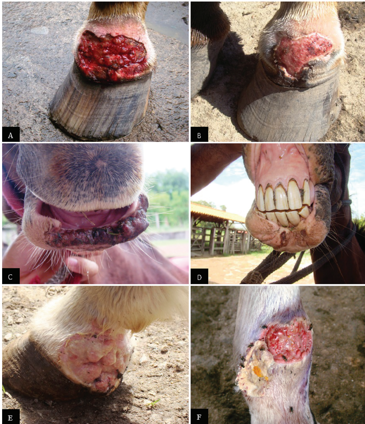
Fig.3. Dermite ulcerativa causada por espinhos de Mimosa spp. (A) Lesão em membro anterior direito na região da quartela com aspecto sanguinolento. (B) Mesma lesão em membro anterior direito na região da quartela em processo de cicatrização. (C) Lesão no lábio inferior com áreas de necrose. (D) Ferida no lábio inferior em processo de cicatrização. (E) Ferida com bordos arredondados e tecido de granulação. (F) Mesma lesão em membro posterior direito na região cranial do boleto, com bordos arredondados com desprendimento de capa necrótica e liberação de conteúdo supurativo.

pele com contornos irregulares, geralmente arredondadas, com exsudação de aspecto sanguinolento. Em alguns casos as áreas ulceradas eram recobertas por crostas. As lesões localizavam-se principalmente nos membros nas regiões da quartela, boleto, jarrete e na cabeça, envolviam lábios superiores e inferiores, focinho, narinas, bochechas e chanfro (Fig.3A-F). Dos 25 equinos acometidos, 9 apresentaram lesões em membro posterior e 16 em membro anterior e,