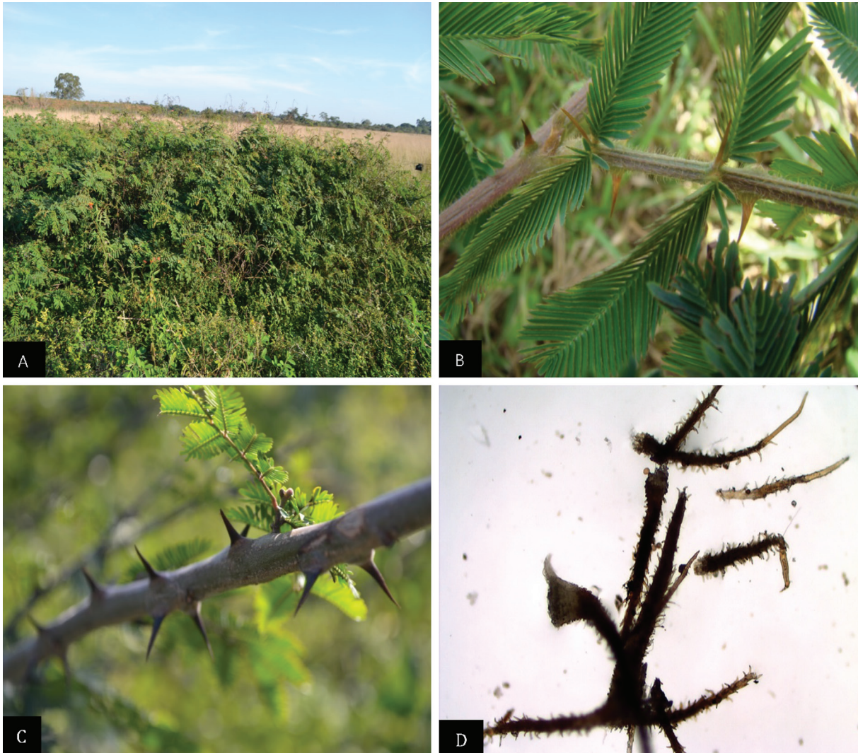
Fig.1. Mimosa setosa . (A) Arbustos de Mimosa setosa com cerca de 2m de altura invadindo a pastagem. (B) Espinhos e tricomas de Mimosa setosa . (C) Espinhos de Mimosa setosa . (D) Espinhos e tricomas hirsutos de Mimosa setosa . Obj.20x.

A princípio, os equinos apresentaram lesões em aranhadura, com aumento de volume local e formação de crosta, que se desprendia 48 horas após o contato com Mimosa spp. Os equinos apresentaram lesões ulcerativas na