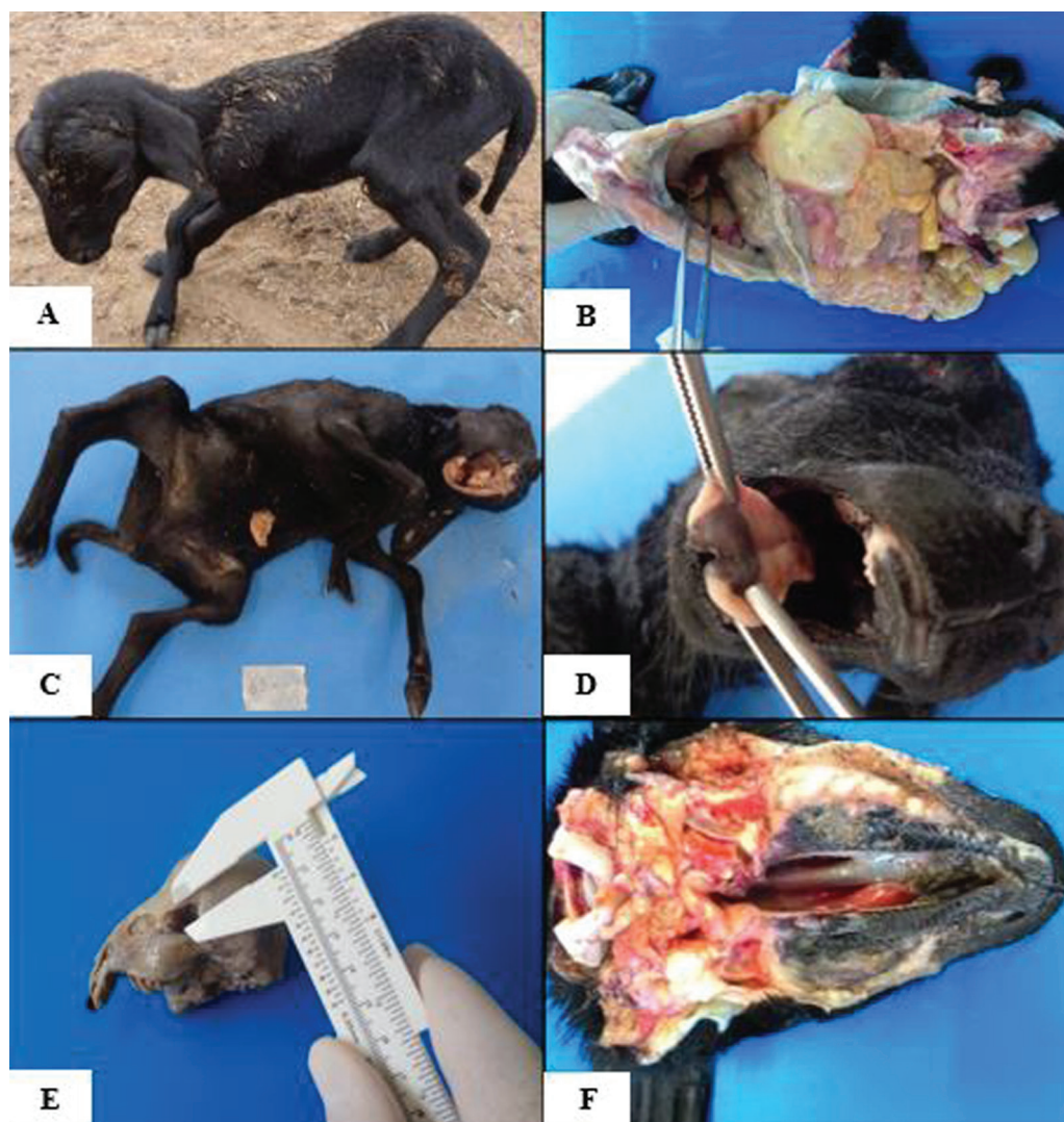
Fig.3. Intoxicação experimental em ovinos por Poincianella pyramidalis . (A) Cordeiro recém-nascido do G2, apresentando artrogripose moderada nas articulações do carpo e tarso. (B) Cordeiro do G2, apresentando hérnia diafragmática congênita. (C) Cordeiro do G3, com polidactilia, monodactilia, artrogripose, hipoplasia de mandíbula, aglossia e aplasia do osso incisivo. (D) Cordeiro do G3, apresentando língua bifida. (E) Cordeiro do G3, com microftalmia apresentando órbita de tamanho reduzido (0,6cm). (F) Cordeiro do G4, apresentando palatosquise.

No G3, uma ovelha abortou aos 116 dias de gestação um feto apresentando artrogripose em todos os membros (tetramelia), atrofia muscular nos membros torácicos e palatosquise. As outras três ovelhas pariram um total de três cordeiros, todos apresentavam múltiplas malformações. As malformações encontradas foram: micrognatia, hipoplasia da mandíbula (unilateral/bilateral) (Fig.3C), ruptura da sincondrose intermandibular, polidactilia bilateral e monodactilia unilateral (Fig.3C), língua bifida (Fig.3D), aglossia,