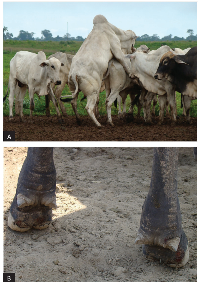
Fig.3. Abrasão de talão. (A) Bovinos machos, Nelore, não castrado realizando sodomia. (B) Erosões no tecido córneo dos talões, na base da sobreunha, quartela e coroa dos membros pélvicos em consequência da sodomia.

Distúrbios de comportamento entre bovinos, como o homossexual (sodomia) foi relatado em todas as propriedades estudadas, principalmente em lotes de animais mestiços de Europeu-Nelore não castrados (Fig.3). Nenhuma das fazendas adotava medidas profiláticas relacionadas às afecções podais. Porém, 16,7% (2/12) das propriedades utilizavam pedilúvio, com solução de formol e sulfato de cobre, para auxiliar na recuperação de animais tratados. Nessas fazendas, os procedimentos terapêuticos, com