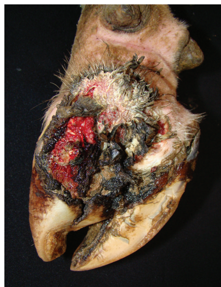
Fig.5. Dermatite digital. Perda de tecido córneo dos talões, sola e muralha abaxial do dígito com presença de pelos longos e espículas de cor variando de enegrecida a branca.