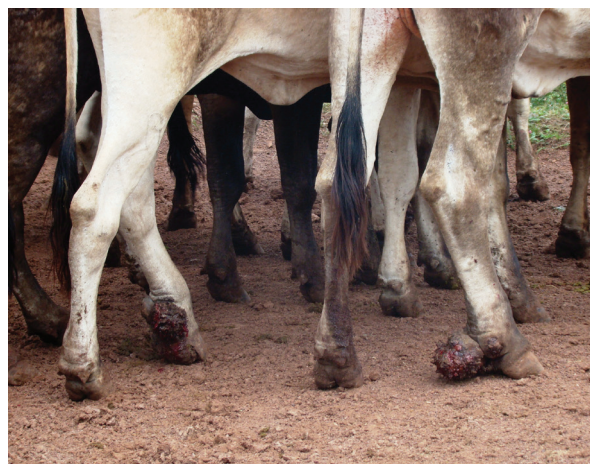
Fig.4. Pododermatite da sobreunha. Bovinos com perda de tecido córneo e proliferação acentuada de tecido de granulação nas sobreunhas dos membros pélvicos.

O espaço interdígital foi mais afetado nas fêmeas, tanto nos membros torácicos com 9,15% quanto nos membros pélvicos com 6,5% das lesões. Nos machos essa região do dígito foi bem menos afetada com 1,89% nos membros torácicos e 1,73% nos membros pélvicos.