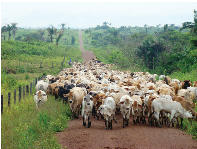
Fig.2. Manejo animal inadequado de bovinos de corte criados na região sudeste do Pará. Lote de fêmeas e bezerras sendo conduzidos ao centro de manejo, percorrendo longas distâncias por vias de acesso pavimentadas com cascalho, para procedimentos reprodutivos.

Nos currais, na tentativa de acelerar os procedimentos, os bovinos eram estimulados pelos tratadores com choques elétricos, fortes pancadas e objetos pontiagudos o que aumentava o estresse e agressividade dos animais.