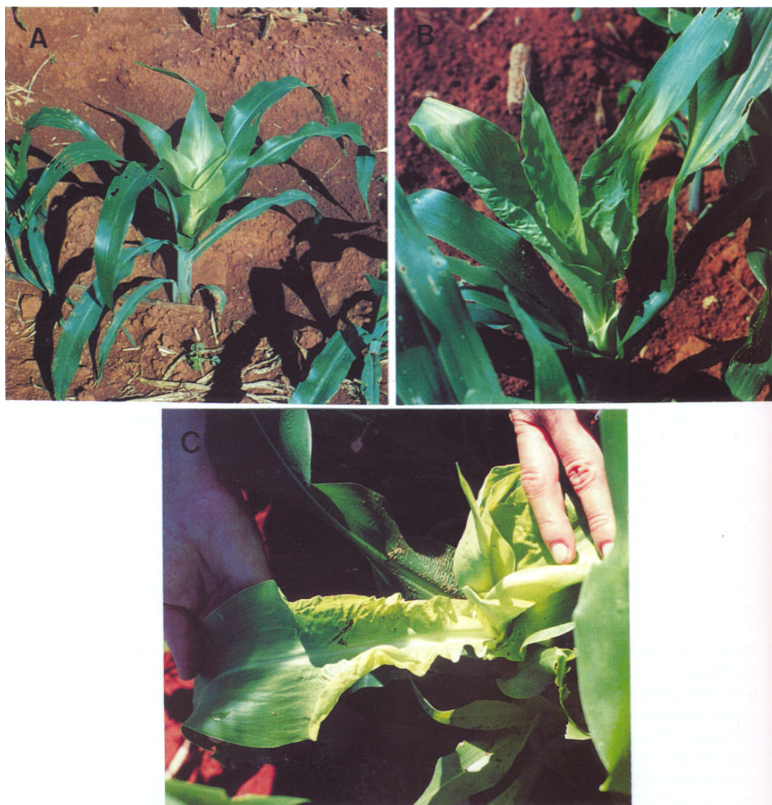
FIGURA 1. Sintomas macroscópicos de fitotoxicidade ao nicosulfuron em plantas de milho: A) clorose das folhas centrais da planta, aos 7 dias após a aplicação do produto. B) deslocamento das manchas cloróticas para a região central da lâmina foliar e enrolamento das extremidades das folhas, aos 14 dias após a aplicação do nicosulfuron. C) clorose e enrugamento da lâmina foliar, 7 dias após a aplicação.