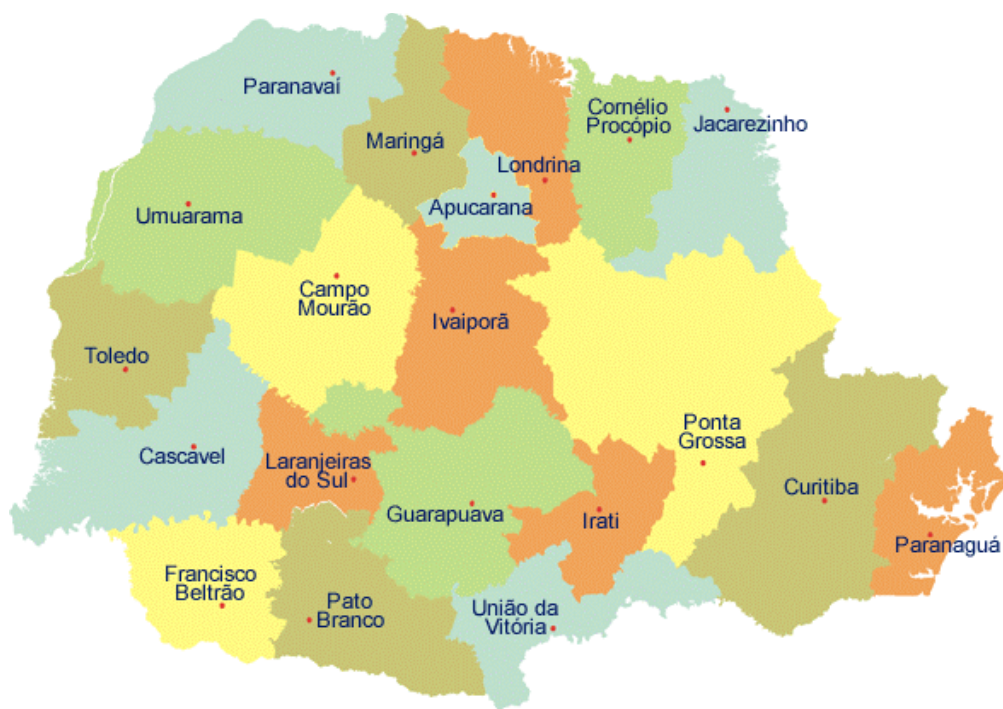
Figura 1 - Distribuição dos Núcleos Regionais da SEAB-PR (2002).

em que GUS representa um índice adimensional, t_{1/2} representa a meia-vida do herbicida no solo (dias) e K_{oc} representa o coeficiente de sorção normalizado para o teor de carbono orgânico ( L\ kg^{-1} ). Herbicidas com GUS < 1,8 são considerados não-lixiviadores, ao passo que índices superiores a 2,8 representam produtos lixiviadores. Aqueles com valores entre 1,8 e 2,8 são considerados intermediários.