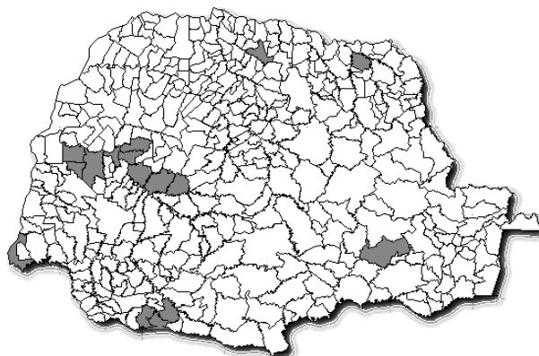
Figura 1 - Mapa do Estado do Paraná, com a localização geográfica dos municípios amostrados em cinza.

No mês de junho de 2003, as sementes coletadas de Bidens spp. foram colocadas em potes plásticos (50 sementes por vaso) com volume de 300 mL, preenchido com substrato areia:solo na proporção de 1:1. Na ocasião dessa semeadura também foram semeadas Bidens spp. sensíveis aos herbicidas inibidores da ALS oriundas de áreas da região de Porto Alegre, para servirem como testemunha.