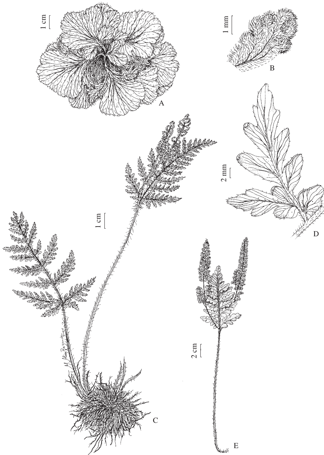
Figura 1. A-B. Anemia elegans . A. Hábito. B. Segmento fértil (RB 36906). C. Anemia ferruginea var. ahenobarba , hábito (Casarino 12). D. Anemia ferruginea var. ferruginea , pina basal (Casarino 18). E. Anemia imbricata , fronde (Casarino 8).

Figure 1. A-B. Anemia elegans . A. Habit. B. Fertile segment (RB 36906). C. Anemia ferruginea var. ahenobarba , habit (Casarino 12). D. Anemia ferruginea var. ferruginea , basal pinna (Casarino 18). E. Anemia imbricata , frond (Casarino 8).