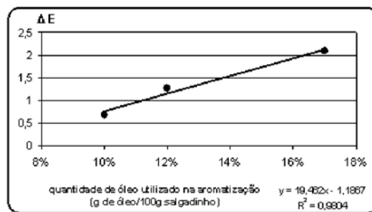
FIGURA 2 - Alteração de cor dos salgadinhos em função da diminuição do teor de óleo de canola utilizado na aromatização