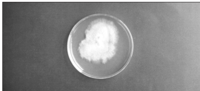
FIGURA 1 – Colônia de Fusarium spp. em ágar batata dextrose

contagem de bolores. Pode-se inferir desta análise que a fase de grão farináceo constitui-se, nas condições do experimento, em um ponto crítico de controle no que diz respeito ao crescimento de bolores, uma vez que a contaminação que ocorre nesta fase não muda significativamente nas fases subseqüentes, tornando-se assim necessário adotar medidas que controlem a contaminação fúngica a partir desta etapa.