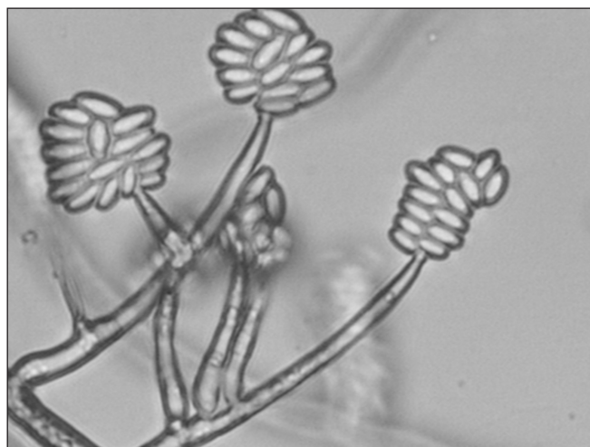
FIGURA 2 – Microcultivo de Fusarium spp. aumento de 800 X.

Utilizando milho como substrato, cepas de Fusarium spp. foram testadas quanto à capacidade de produzir micotoxinas. Os resultados obtidos por kits de imunoenaios quantitativos ELISA-Competitivo Indireto, revelaram que 100% das cepas testadas possuíam a capacidade de produzir fumonisinas. A média de produção encontrada para as cepas isoladas das três fases de desenvolvimento, onde Fusarium spp. se mostrou presente (grão farináceo, grão farináceo-duro e maturação fisiológica) foi de 11 ppm.