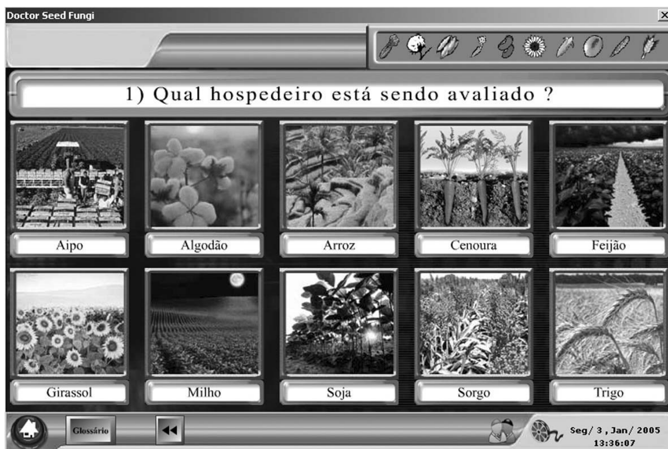
FIGURA 2. Tela do SE “Doctor Seed Fungi”.

prático desses grupos para identificar fungos no método de incubação em papel de filtro. Considerando todas as culturas e fungos avaliados, o grupo 1, composto por especialistas da área do conhecimento contido no SE, apresentou, em média, 62,3% de acerto antes de utilizar o programa e 92,5% após sua utilização (Tabela 1). Os grupos 2 e 3 apresentaram, em média, 0% de acerto antes de usar o programa e, após a sua utilização, essa porcentagem subiu, em média, para 88,1% e 95,2%, respectivamente (Tabela 1). Esses resultados indicam a correta aplicação do SE na organização e estruturação do conhecimento sobre Patologia de Sementes, pois o problema estruturado no programa apresenta domínio de aplicação bem definido, delimitado e específico, satisfazendo características de SEs mencionadas por Huggins et al. (1986), Bänder (1994) e Turban (1995).