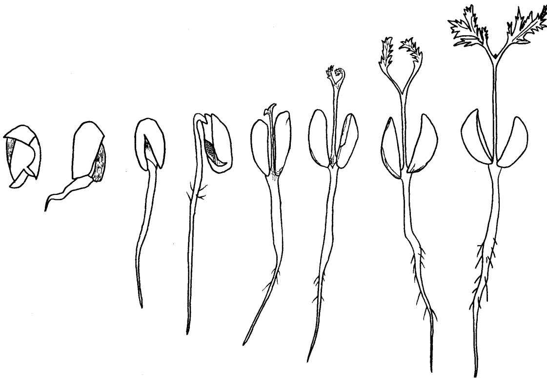
FIGURA 2. Estádios sucessivos do desenvolvimento da plântula de Azadirachta indica A. Juss. durante 30 dias: a-b – protrusão da raiz primária; c-d – rompimento do endocarpo e tegumento; e – abertura dos cotilédones e plântula normal; f – emissão do epicótilo.

iniciar o processo germinativo, uma vez que a porcentagem de sementes germinadas na temperatura alternada (20°30°C) foi inferior aquela ocorrida em temperatura constante de 35°C.