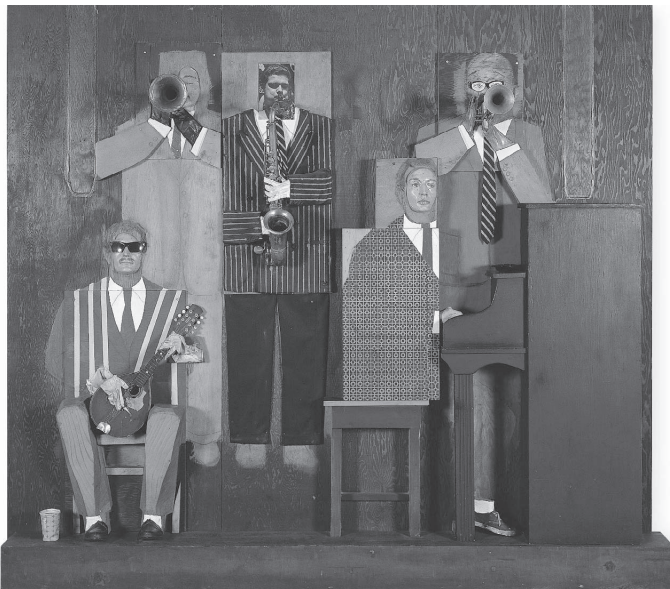
Foto: Museum of Contemporary Art, Chicago; Licenciado por AUTVIS, Brasil, 2008 © VAGA, NY

Papel, tinta e objetos encontrados em madeira, 241.3 x 271.8 x 35.6 cm Coleção Museum of Contemporary Art, Chicago, doação parcial de Ruth Horwich