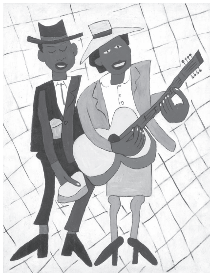
Foto: Smithsonian American Art Museum, Washington, DC/ Art Resource, NY. © Copyright

William H. Johnson (1901-1970) – Músicos cegos (ou “Músicos de Rua”), circa 1940-45.