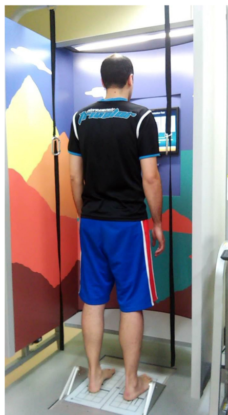
Figura 1 Avaliação do equilíbrio postural dos atletas por meio da posturografia dinâmica computadorizada.