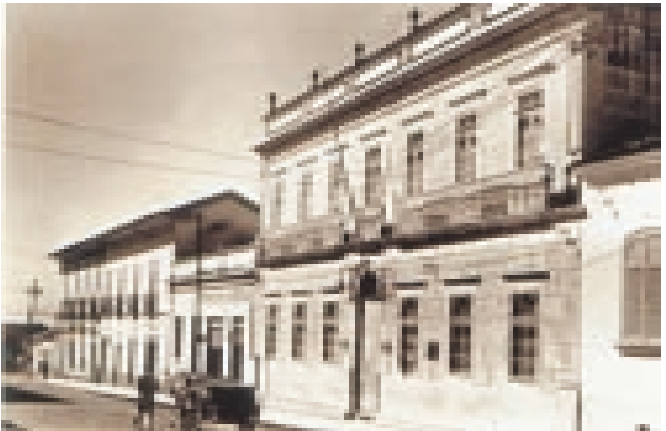
FIGURA 7 – Prédio do Museu Republicano Convenção de Itu (Itu-SP). Década de 20 (séc. XX). Outro ângulo da Rua do Carmo (atual Rua Barão do Itaim).