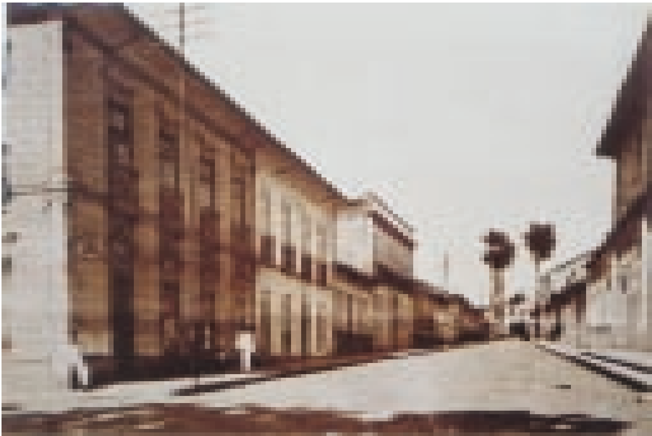
FIGURA 3 – Rua do Carmo (atual Rua Barão do Itaim). 1940 Em primeiro plano, o conjunto de edifícios (2 sobrados) e uma casa térrea, construídos na primeira metade do século XIX pelo Tenente Elias Antonio Pacheco.