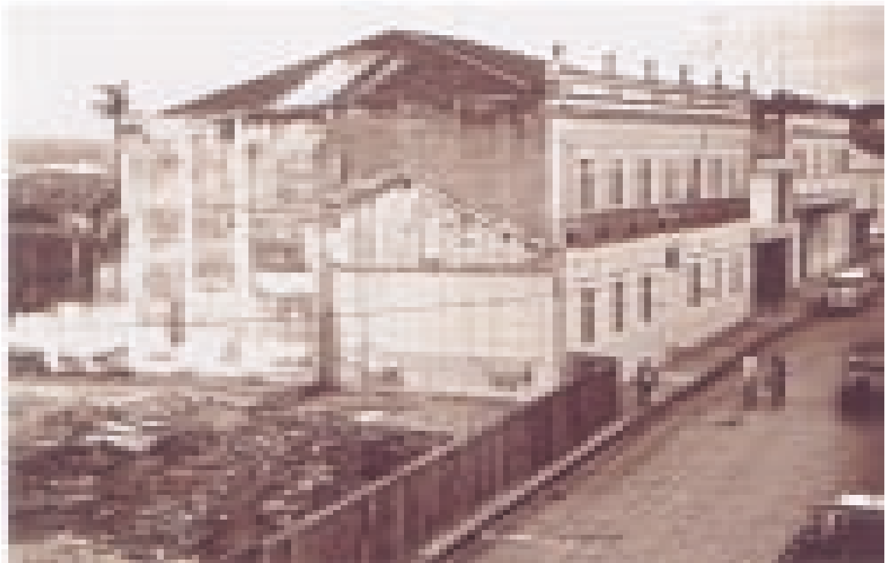
FIGURA 5 – Rua do Carmo (atual Barão do Itaim). Década de 70 (séc. XX) Em primeiro plano, a demolição dos antigos sobrados construídos no início do século XIX.