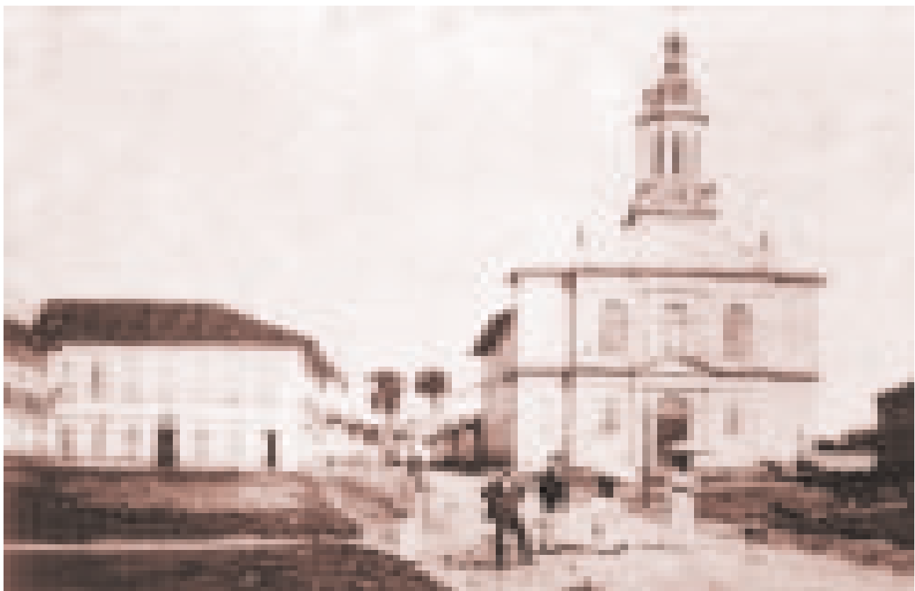
FIGURA 4 – Largo da Matriz (atual Praça Padre Miguel). 1899.