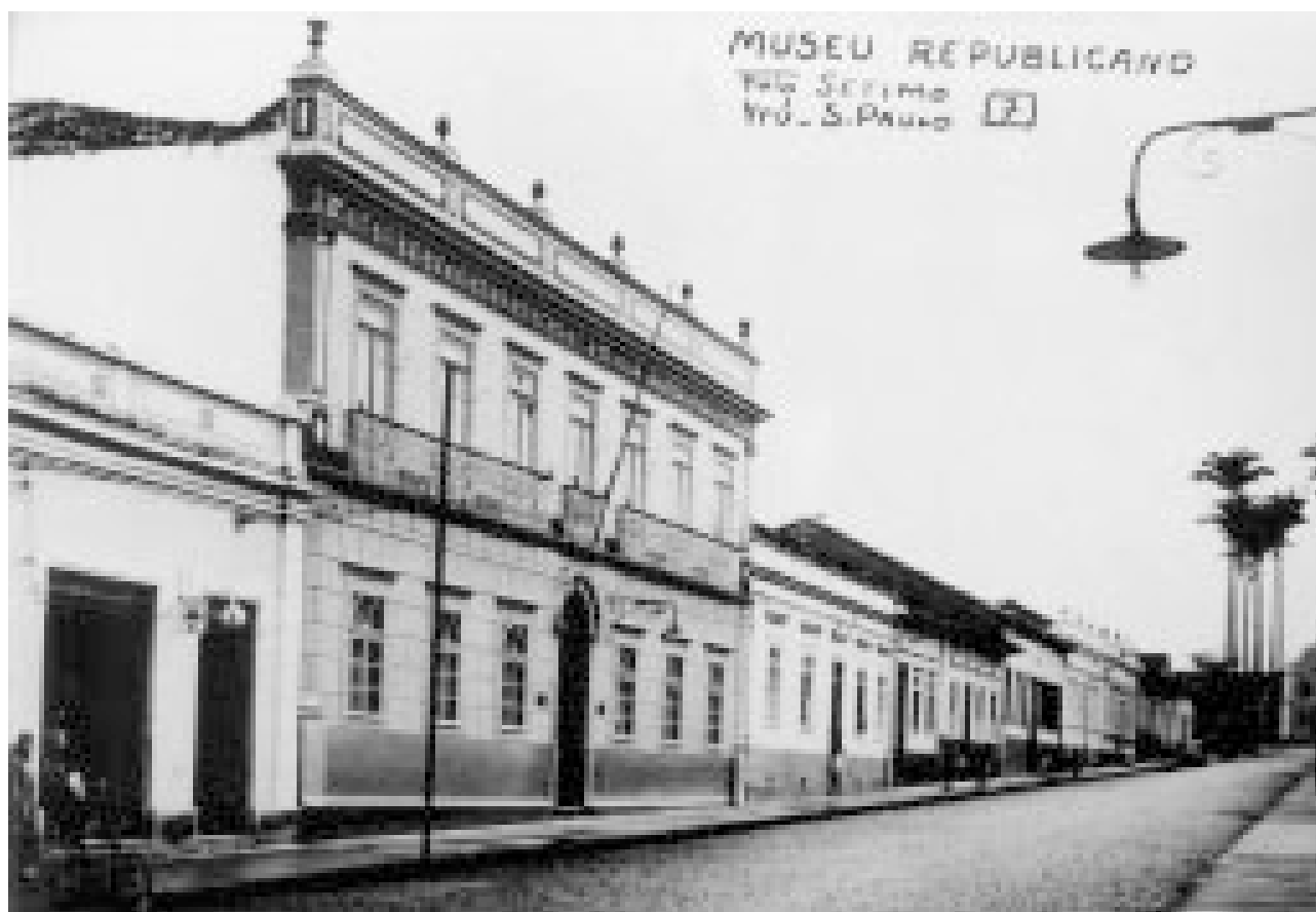
FIGURA 6 – Prédio do Museu Republicano “Convenção de Itu” ( Itu-SP). Década de 20 (séc. XX.) Parte inferior do edifício (6 janelas e 1 porta) em substituição às 7 portas existentes no século XIX. E a parte superior (7 portas), em substituição às 7 janelas do século XIX.